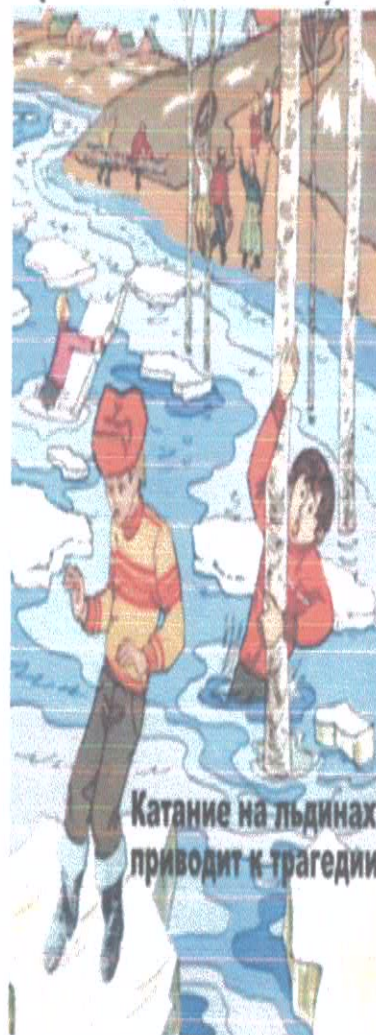
Катание на льдинах приводит к трагедии

Приближается время весеннего паводка. Лед на реках становится рыхлым, «съедается» сверху солнцем, талой водой, а снизу подтачивается течением. Очень опасно по нему ходить: в любой момент может рассыпаться под ногами и сомкнуться над головой.